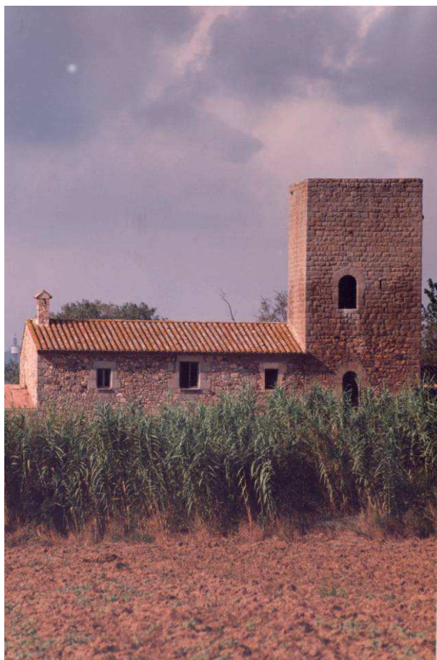
Torre del Mas Petit d'en Caixa

Història: torre aïllada a la qual s'hi va adossar, a finals del segle XVII o principis del segle XVIII, un mas.