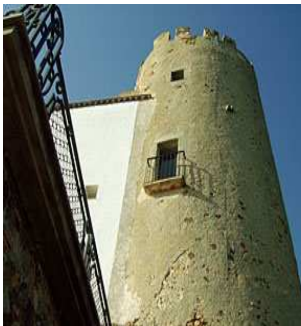
Torre de St. Sebastià

Història: es va començar a bastir l'any 1445, i a la planta baixa va acollir la primitiva ermita de Sant Sebastià. A conseqüència de la pesta dels anys 1650 i 1651, es va decidir construir la nova ermita i l'hostatgeria, que es va adossar a la façana sud de la torre. Les obres van començar l'any 1707 i es van poder construir gràcies a les recaptades fetes entre els habitants del terme de Palafrugell i les prestacions particulars. L'hostatgeria té algunes llindes datades del 1730 i del 1832. Durant l'any 1994-95, es van realitzar algunes obres de reforma, neteja i consolidació.