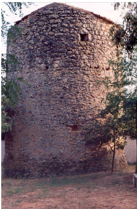
Torre de vila - Seca

Història: fins a principis dels anys 60, estava adossada a un mas de construcció posterior a la mateixa torre. Actualment està abandonada. Podia haver estat una torre de defensa col·lectiva.