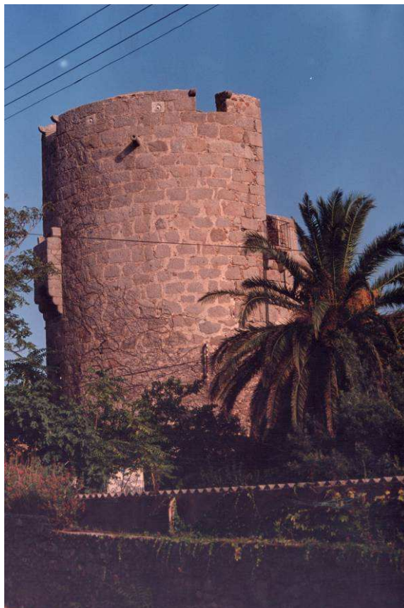
Torre de Calella de Palafrugell