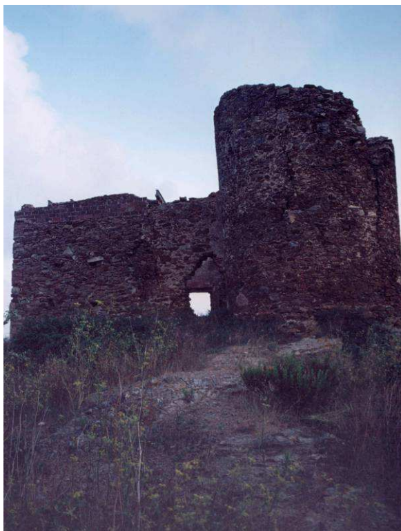
Torre dels Moros (Torretes)

Història: actualment està en molt mal estat i adossada a un mas de construcció molt posterior. Tot en runes. En el seu temps va ser, sens dubte, un bon trampolí de senyals vers els pobles de Palafrugell, Llofriu, Mont-ras, Esclanyà i Regincós. Des de la primera planta, es divisa una panoràmica als quatre vents que la fa, juntament amb les de Sant Sebastià i Calella, una de les torres més importants dins el sistema defensiu de Palafrugell.