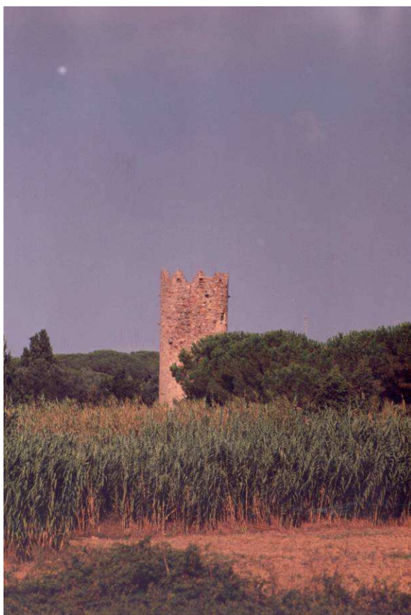
Torre Mas Sureda

Història: torre que servia de defensa d'un mas dels segles XVI-XVII que estava al costat, actualment està connectat per un pont a la casa que es va construir en enderrocar el mas.