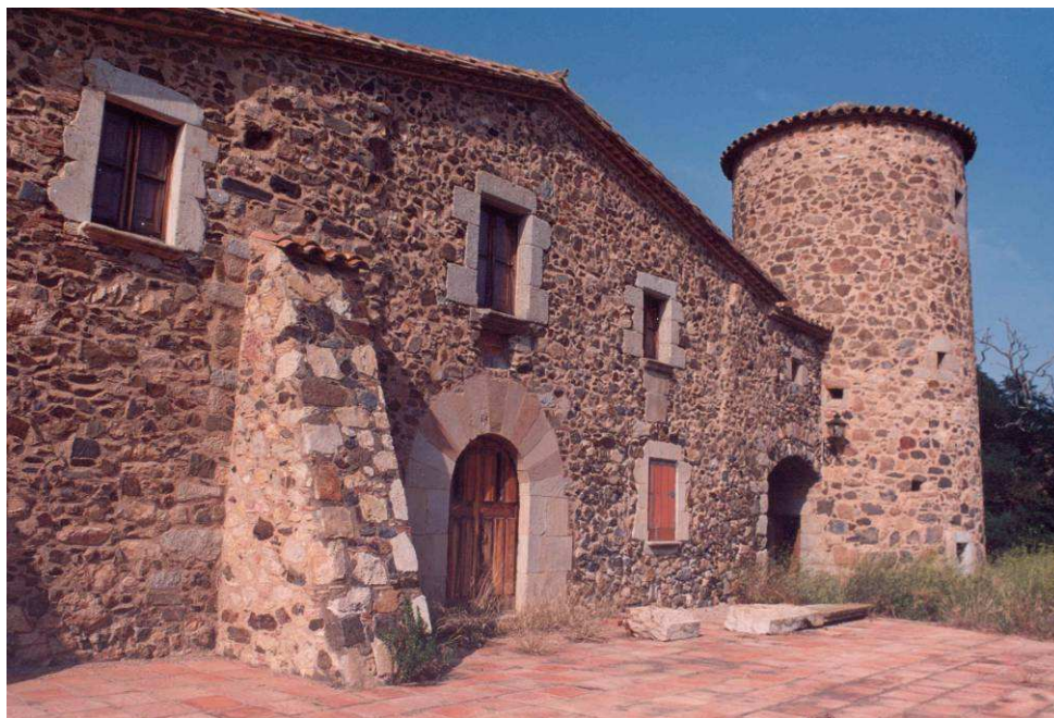
Torre del Mas Gorgoll (o de Can Niell)

Història: torre aïllada, comunicada per un pont al mas Gorgoll.