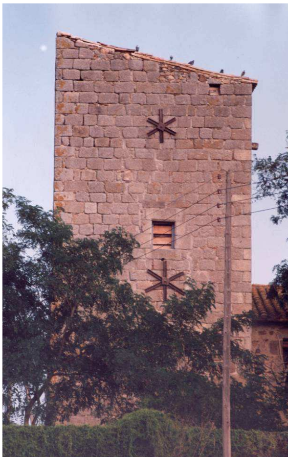
Torre del Mas Fina

Actualment està adossada a un mas dels segles XVII-XVIII.