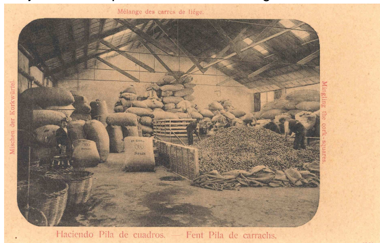
Antic magatzem de la fàbrica, una de les primeres naus construïdes i avui desapareguda.

(els despatxos de direcció), el magnífic magatzem amb encavallades de fusta i tirants de ferro sobre pilars de 20 metres de llum (una de les parts més antigues de la fàbrica), les tres naus adossades que hi havia camí del dipòsit (antics tallers de fusteria, mecànics)... Tampoc s'hi tenien en compte els forns de la bòbila Vella, i les naus de la Bòbila Nova. El resultat va ser que