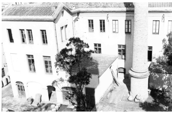
Edifici dels forns i xemeneia de l'edifici de l'actual Fundació Vila Casas

Analitzant a posteriori com han quedat repartides les propietats i sobreposant-hi el plànol de l'antiga fàbrica ens adonem que es podria haver conservat sense problemes molt patrimoni arquitectònic ara enderrocat. I que en comptes d'estar en un projecte de rehabilitació i construcció de Can Mario per ubicar-hi el museu, segurament ara estaríem parlant únicament d'un projecte de rehabilitació . Al marge de les voluntats polítiques, que al final resultaren les determinants, tampoc va ser de molta ajuda el Pla Especial de Protecció i Intervenció en el Patrimoni, aprovat definitivament l'any 1991, absolutament novèdós, interessant i modèlic en molts aspectes, però que a l'espai de Can Mario li va faltar la concreció adequada que hagués posat en valor molts dels elements del conjunt. És van perdre les oficines antigues en forma d'U adosats a les naus principals