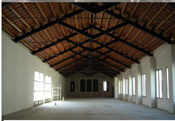
Nau sud, pis